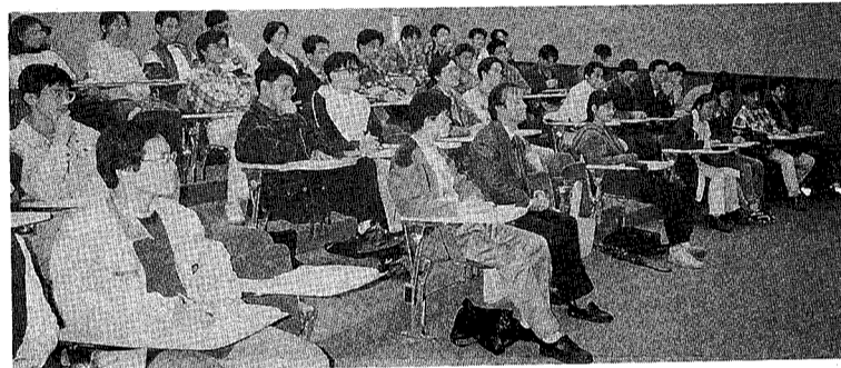
包教授演講現場一瞥

至於目前這個階段，其實最該做的是加強兩岸各層面的交流與接觸。像我們同學們就可以多跟對岸如北大、上海復旦等校未來可能成為中國大陸之中堅或領導人才的老同學們，多做各種學術或文化的接觸交流。如此才能使雙方人民對彼此更加了解，也才能發展友善的雙邊關係。現階段有許多存在於兩岸間的誤會或者誤解，引起不必要的緊張氣氛，倘若彼此了解得更多更深就不會如此了。像很多大陸民眾甚至學者，在不了解台灣的制度與民意之前，一直以為所謂的「務實外交」是政府刻意製造、而民眾並不作此想。等他們進一步了解台灣的民主政治多元發展之後，才真正體會到兩岸觀念想法的不同，也才能更務實地面對兩岸問題。我想只有當雙方均能更相互尊重彼此的立場時，彼此的距離才能逐漸拉近，中國的和平統一也才有實現的可能。