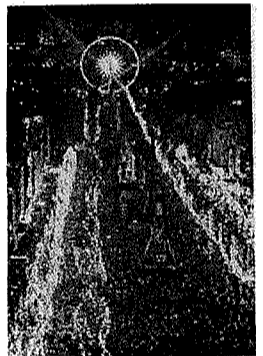
燈火輝煌的法國香榭麗榭大道