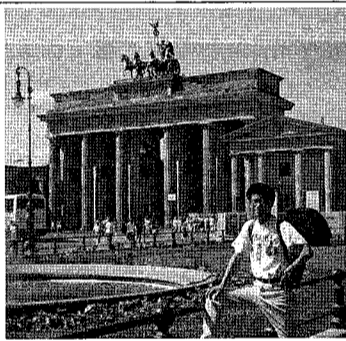
筆者身後即為著名的布蘭登堡門

100號公車還途經下列景點：西柏林的精神象徵—毀於戰火的威廉大帝紀念教堂；普法戰爭勝利女神像(德國導演文德斯的名作「柏林的天空」(Himmel über Berlin)中，小精靈們就在女神像上看著柏林的興衰)；包浩斯文獻館(Bauhaus-Archiv)—德國建築藝術中現代主義的縮影；帝國議會(Reichstag)—俾斯麥時代興建，現為德國聯邦眾議院所在地。德國人