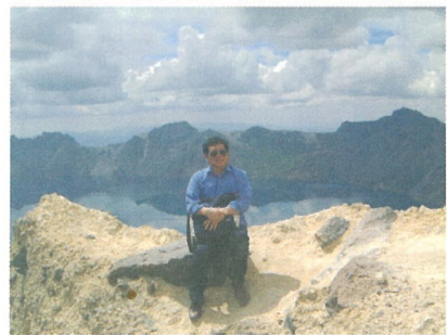
作者攝於長白山天池