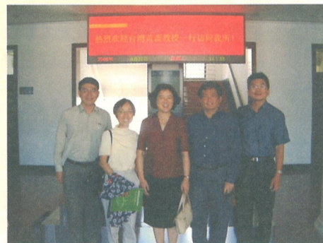
台灣學者與中央教科所朱所長合影