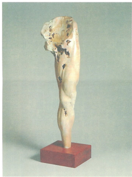
韓旭東木雕作品之一：『左腿無名』

塊肉餘生錄的尾聲中有一齣場景：暮雲靄靄，潑墨般灰暗的天地，男主角David Copperfield獨自站在朔風凜冽的沙灘上，望著茫茫大海，喃喃道：What am I searching for?其實我們幾乎也都曾在不同的情境下問過自己同樣的問題：我到底在找尋什麼？