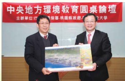
■99年12月28日特邀請中大校長蔣偉寧、環保署長沈世宏、桃園縣長吳志揚、荒野保護協會桃園分會，以及校內十多位專家學者展開論壇。從教育價值觀改變、珍惜在地資源、與世界連結等多方建言。同時為中大的「環境教育中心」催生。