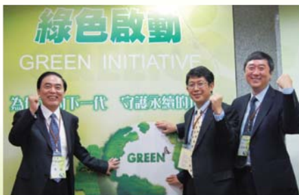
■中央大學、香港中文大學與南京大學基於保護地球，增進人類福祉之共同使命，於100年5月30日三院校長於中央大學共同完成兩岸三地「綠色大學」聯盟簽署行動。